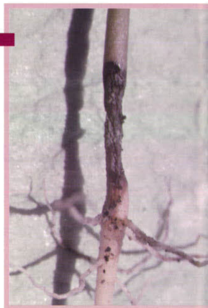
Figura 12 Constricción del hipocótilo por ataque de Rhizoctonia solani , causante del volcamiento de la plántula.

(Deuteromycetes), (Hawksworth et al. , 1995). Aunque las características del género son vagas, las colonias en medio de cultivo producen una textura algodonosa con pigmentación micelial en tonos variables de marrón (Parmeter et al. , 1969; Ogoshi, 1987). Al microscopio no se observan conidias, pero sí ramificación en ángulo recto (Figura 13), cercana al septo distal en las hifas jóvenes, que presentan una relación anchura:longitud generalmente mayor de 5:1; también formación de un septo cercano al punto de origen de la ramificación y constricción en forma de copa en la ramificación. Se nota el septo doliporo y ausencia de conexiones en grapa y rizomorfos. Aunque produce esclerocios, no se han observado en aislamientos provenientes de café, donde sí se aprecian células multinucleadas que tienen entre 5 y 8 núcleos por célula (Gaitán y Leguizamón, 1992).