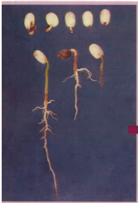
Figura 11 Ataque de Rhizoctonia solani durante la germinación de la semilla y desarrollo del hipocótilo en la etapa de germinador.

(Deuteromycetes), (Hawksworth et al. , 1995). Aunque las características del género son vagas, las colonias en medio de cultivo producen una textura algodonosa con pigmentación micelial en tonos variables de marrón (Parmeter et al. , 1969; Ogoshi, 1987). Al microscopio no se observan conidias, pero sí ramificación en ángulo recto (Figura 13), cercana al septo distal en las hifas jóvenes, que presentan una relación anchura:longitud generalmente mayor de 5:1; también formación de un septo cercano al punto de origen de la ramificación y constricción en forma de copa en la ramificación. Se nota el septo doliporo y ausencia de conexiones en grapa y rizomorfos. Aunque produce esclerocios, no se han observado en aislamientos provenientes de café, donde sí se aprecian células multinucleadas que tienen entre 5 y 8 núcleos por célula (Gaitán y Leguizamón, 1992).