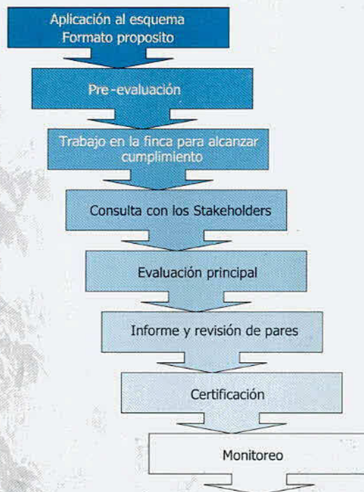
Figura 15.2. El proceso de certificación [Higman et al. 2005]

Los detalles varían de acuerdo al esquema, pero lo esencial esta representado en la Figura 15.2.