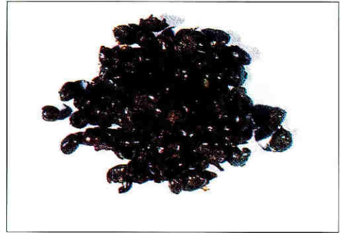
Pulpa mezclada con mucilago