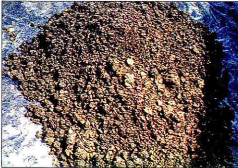
Pulpa de café