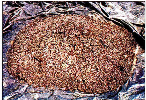
Pulpa mezclada con mucilago