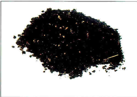
Composte de pulpa sola