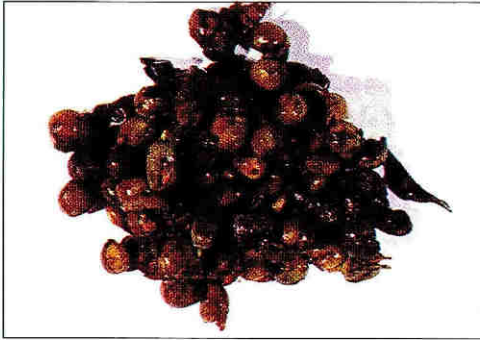
Pulpa de café