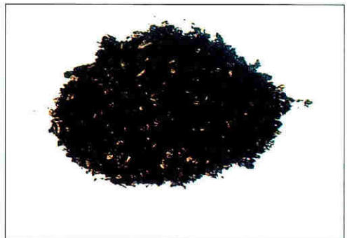
Composte de pulpa mezclada con mucilago