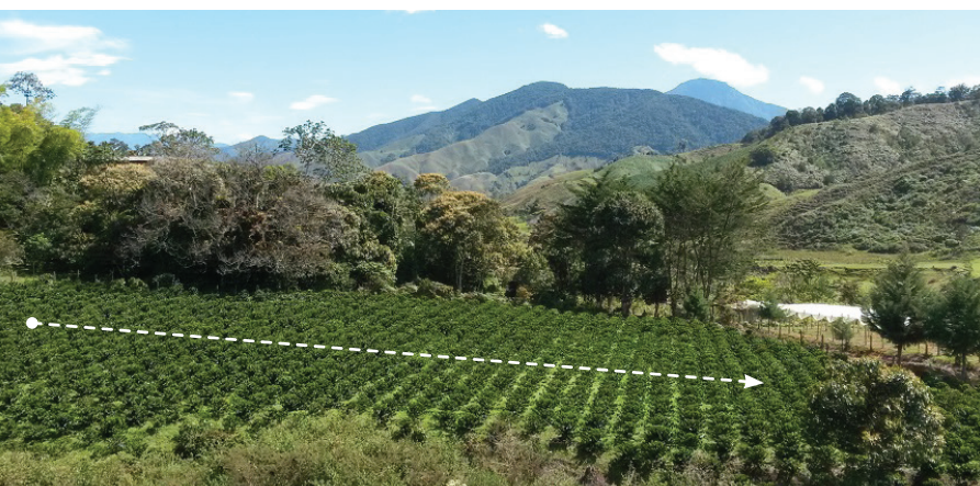
Figura 1. Selección de los árboles en un lote de café, en el surco central.