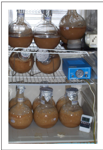
Figura 1. Fermentación alcohólica del mucílago.

Con el volumen del destilado y los grados alcohólicos se determinó la cantidad de alcohol obtenido en el proceso de fermentación, por cada litro de la solución agua-mucílago.