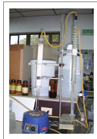
Figura 3. Deshidratación del alcohol.

Determinación del contenido de etanol. Para la determinación del contenido de etanol en las muestras rectificadas y deshidratadas se utilizó el método del hidrómetro (Figura 4) y se comparó con el método del picnómetro (Método 942.06 de la AOAC) (1). Con los valores de densidad y las Tablas donde se relaciona la densidad de soluciones de etanol saturado de aire y agua según la temperatura (8), basadas en Spieweck y Bettin (24), se determinó el contenido de etanol en porcentaje v/v y luego en porcentaje p/p de