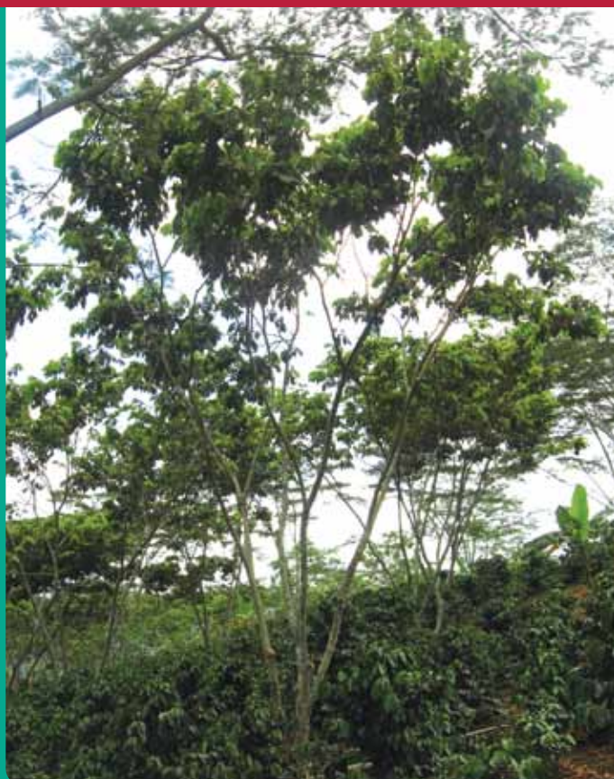
Figura 2. Árbol de Inga edulis (Guamo santafereño) adecuadamente podado y formado.