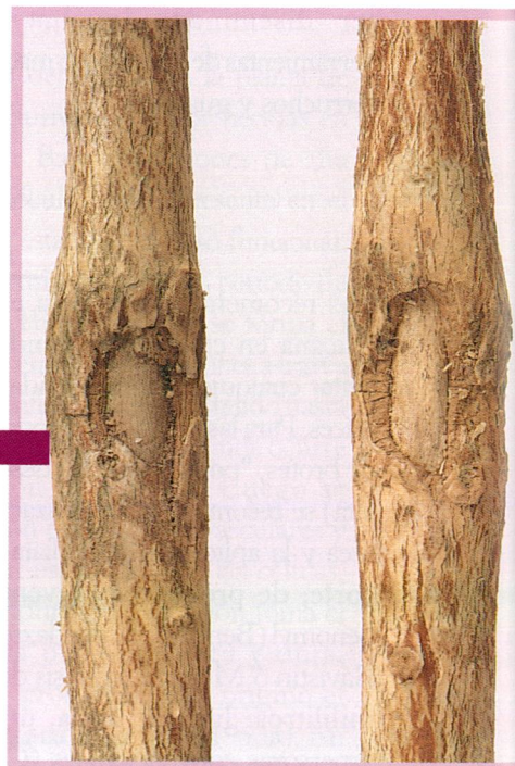
Figura 32 Formación de tejido corchoso de cicatrización alrededor de la lesión por Ceratocystis fimbriata en una planta resistente.

Cadena et al. , 1968). A partir de esta planta y después de numerosos estudios Cenicafé determinó este material como una línea de Borbón resistente a macana (BRM) (Castillo, 1982). A partir de esta fuente de resistencia y mediante cruzamientos con plantas de la variedad Caturra, se ha desarrollado una variedad comercial de café de porte bajo, buenas características agronómicas y organolépticas y altamente resistente a C. fimbriata , aunque susceptible a roya ( Hemileia vastatrix ) (Castro y Cortina, 2002). Esta variedad puede ser utilizada en zonas de alta incidencia de la enfermedad (topografía pendiente) y baja incidencia de roya. Igualmente se encuentran en curso trabajos en los cuales se ha preseleccionado material con resistencia simultánea a la llaga macana y a la roya (Castro, 2002).