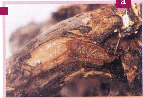
Figura 22 Signos del ataque de Rosellinia : (a) Micelio en forma de estrella de R. pepo ; (b) Puntos y rayas negras correspondientes a estructuras de Rosellinia bunodes