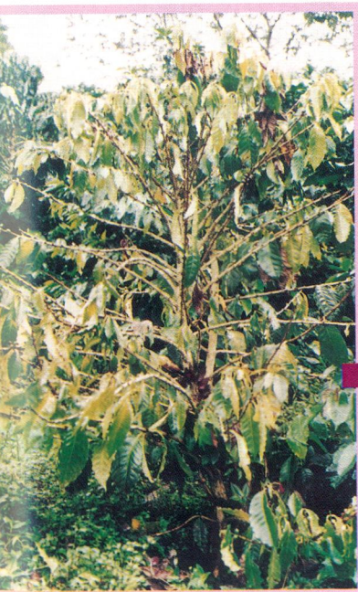
Figura 21 Marchitamiento generalizado del follaje y muerte de la planta ocasionados por las llagas radicales del cafeto ( Rosellinia bunodes y/o R. pepo ).

Los síntomas externos se evidencian cuando la infección alcanza el cuello de la planta. También puede ocurrir un ataque directo