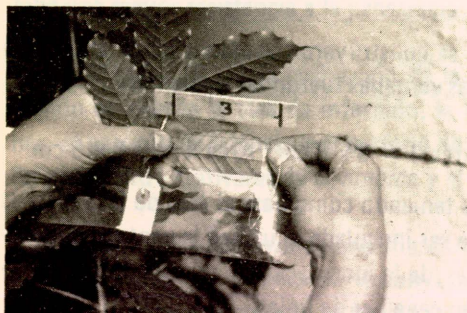
FIGURA 1.- Sistema utilizado para la inoculación de las plantas, empleando ventanas de áreas conocidas.

Período de incubación: Se consideró cumplido el PI cuando en el 50 por ciento de las lesiones resultantes se observó esporulación. La lectura fue individual para cada hoja y para la planta se tomó la totalidad de las lesiones.