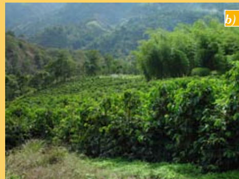
Figura 1. a) Cafetales a libre exposición solar y con sombrío en El Cairo; b) Detalle del cafetal al sol; c) detalle del cafetal con sombrío.