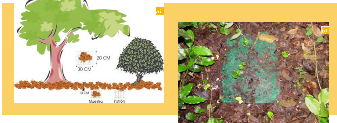
Figura 4. a) Ubicación de las bolsas para evaluar la descomposición del material vegetal dentro del cafetal; b) Bolsa ubicada en el lote.

Dado el carácter exploratorio del estudio, se realizó un análisis estadístico descriptivo con la información de las dos localidades, se empleó la prueba de diferen-