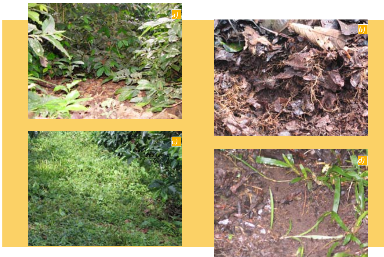
Figura 6. a y b) Superficie del suelo en cafetales con sombrío de guamo; c y d) Superficie del suelo en cafetales a libre exposición solar.

Igualmente, la capa de hojarasca forma humus y por tanto, incrementa la materia orgánica estable del suelo.