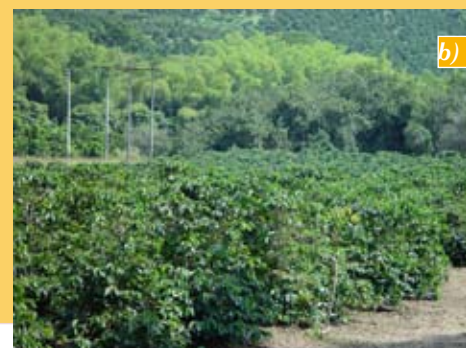
Figura 2. a) Cafetal con sombrío y b) Cafetal al sol en el municipio de Chinchiná.