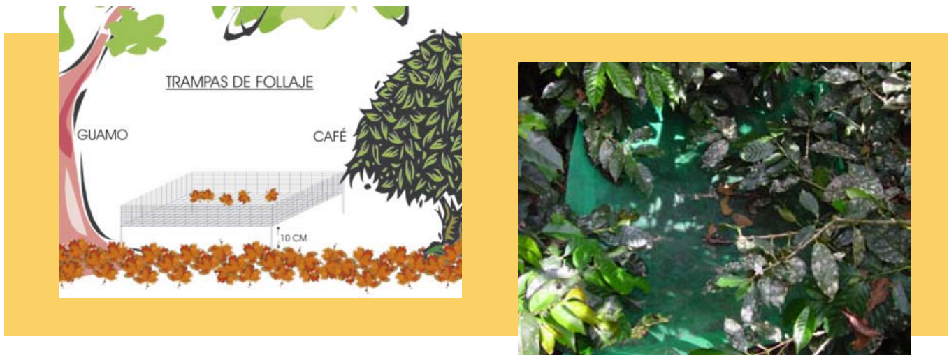
Figura 3. Izquierda, esquema de la trampa de follaje para recolección de material orgánico; derecha, trampa ubicada en el cafetal.