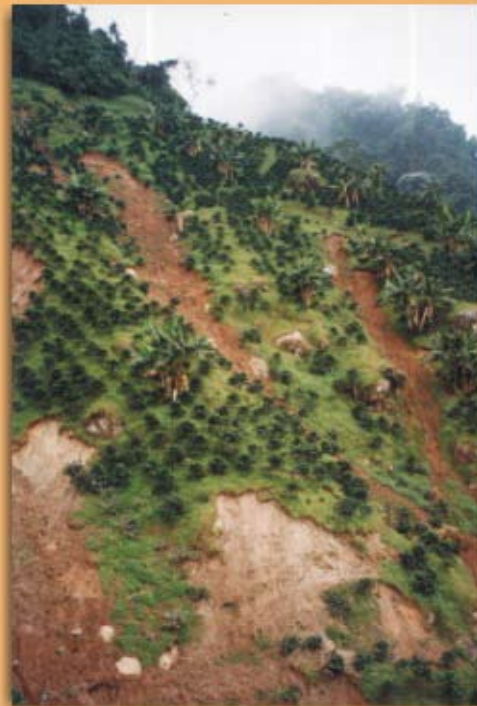
Conflicto en la vocación de uso del suelo; frecuencia 39%

El tipo de sistema de cultivo y su localización son factores que influyen en la estabilidad de las laderas; los cultivos incrementan poco a poco la cohesión del suelo en lo profundo del perfil, como es el caso del café a libre exposición solar (1), y por ende, poco contribuyen a su estabilidad. En muchas ocasiones este incremento se ve reflejado solo en las primeras capas de suelo como es el caso de los pastos, los cuales ofrecen alta resistencia al corte sólo en los primeros 30 cm de profundidad (6).