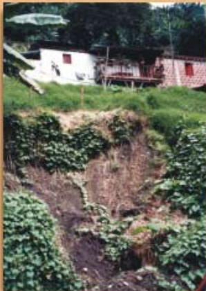
Viviendas sin canalización de las aguas de los techos; frecuencia 23%