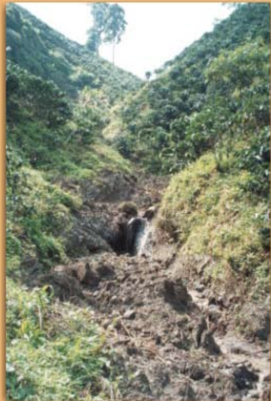
Figura 2. Desprotección de los drenajes naturales; frecuencia 58%

La principal manera de prevenir los movimientos masales y problemas de erosión avanzada es dejando intactos los drenajes naturales por pequeños que éstos sean. La protección de drenajes naturales debe iniciarse en cada finca, con vegetación espontánea propia de la zona. No deben extenderse los cultivos hasta la orilla de los drenajes. En la ley ambiental colombiana está estipulado que debe protegerse un margen de 30 m a lado y lado