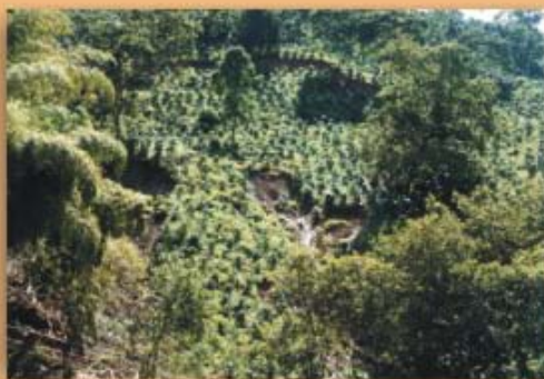
Ausencia de sistemas de drenaje en suelos con nivel freático alto; frecuencia 19%