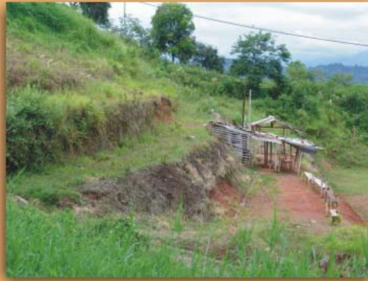
Conformación de terraplenes sin las debidas medidas de drenaje; frecuencia 3%