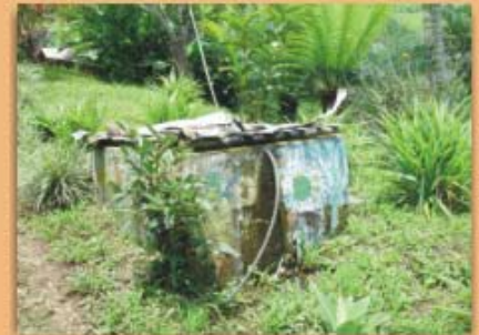
Fosas o pozos sépticos mal construidos o almacenamiento de agua sin especificaciones técnicas adecuadas; frecuencia 23%