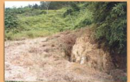
Ausencia de cunetas o taponamiento de las ya existentes en caminos o carreteras; frecuencia 45%