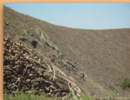
Desyerba indiscriminada con herbicida o azadón; frecuencia 45%