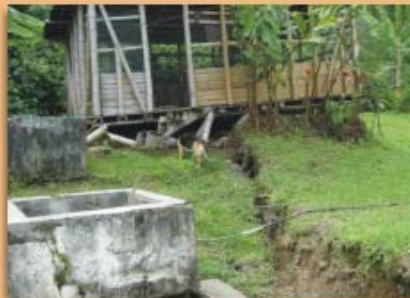
Agrietamientos de canales o tanques de almacenamiento de agua; frecuencia 13%