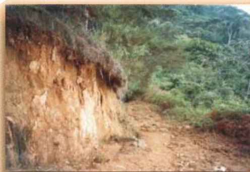
Presencia de escapes en taludes de alta pendiente; frecuencia 6%