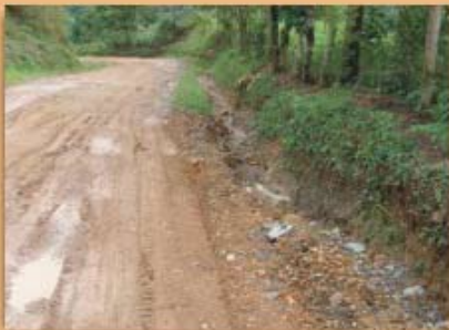
Canales sin revestimiento, que concentran altos volúmenes de agua y la entregan a sitios sin protección vegetal; frecuencia 13%

masales o cárcavas. Lo anterior generalmente provoca saturación del terreno o concentración de los altos volúmenes de agua por un solo sitio. Cuando el agua satura el terreno, la presión se convierte en una carga o esfuerzo adicional que aplicada a la masa de suelo causa su movimiento, en tanto que el flujo de agua concentrado por un solo sitio sin disipación de su energía o velocidad, causa socavamientos y arrastra sedimentos, que conllevan a la formación de cárcavas (Figura 3).