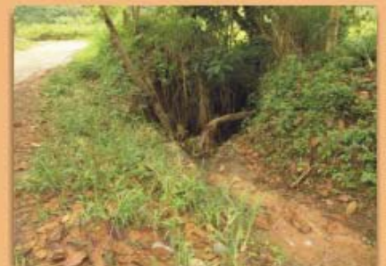
Ausencia de cajas recolectoras en caminos o carreteras y entrega inadecuada de aguas a media ladera; frecuencia 52%