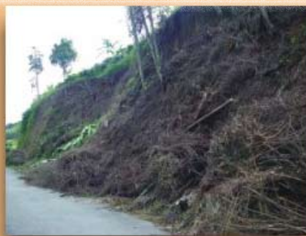
Desprotección de taludes por medio de desyerbas intensivas frecuencia 13%