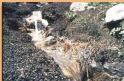
Aguas provenientes de las viviendas, y los beneficiaderos, sin canalización o conducción adecuada; frecuencia 35%