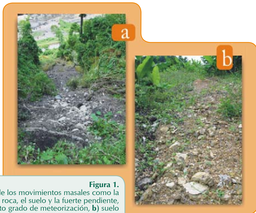
Figura 1. Algunas causas naturales de los movimientos masales como la susceptibilidad de la roca, el suelo y la fuerte pendiente, a) roca metamórfica en alto grado de meteorización, b) suelo muy superficial sobre roca sedimentaria

Es común que las causas de los movimientos masales y la erosión avanzada se repitan en una zona con características ambientales similares. En la mayoría de los casos de inestabilidad, existen un gran número de causas simultáneas así que intentar decidir cuál fue la causa final no solo es difícil sino también incorrecto (7). Frecuentemente el factor causante final, por ejemplo,