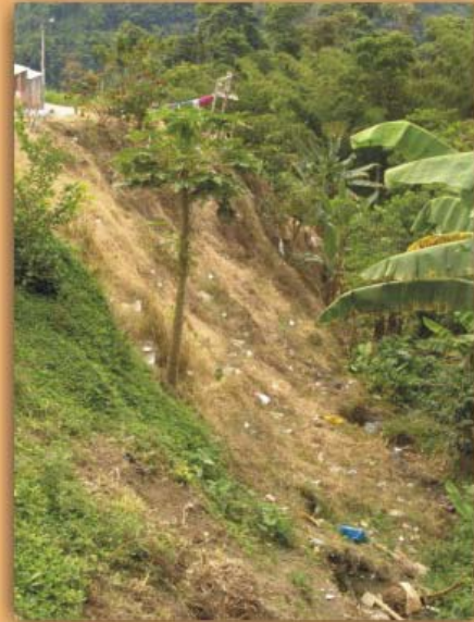
Depósito de basuras en las laderas; frecuencia 6%