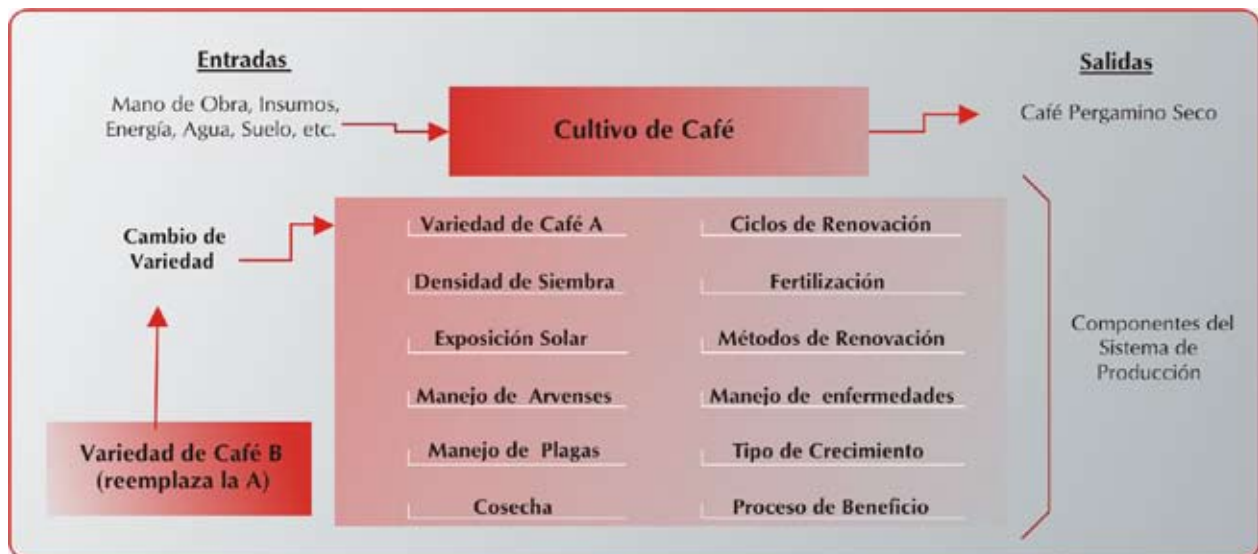
Figura 2. Concepto de sistema de producción en café

Viabilidad del cambio tecnológico. El cultivo de café es un sistema que tiene unas entradas representadas por factores de producción como mano de obra, insumos, tierra y energía, entre otros, y un producto final del sistema que es el café pergamino seco obtenido. De igual forma, en su interior este sistema está conformado por varios componentes, como son la variedad de café, la densidad de siembra, los ciclos de renovación, la fertilización, la exposición solar, los métodos de renovación, el manejo de arvenses, el manejo de enfermedades, el manejo de plagas, el tipo de crecimiento, las formas de cosecha y el tipo de beneficio (3) (Figura 2).