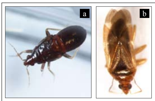
Figura 2. Xylocoris sp. (Hemiptera: Anthocoridae) depredador de estados inmaduros de H. hampei . a). Ninfa; b). Adulto.

A pesar de las altas frecuencias en que fue encontrada Wasmannia sp. (80,9% de las fincas y 39,2% de los frutos), esta hormiga perteneciente a la subfamilia Myrmicinae, causa picazón a las personas, y en el caso de Wasmannia auropunctata (Roger), este insecto puede eliminar especies de hormigas nativas y otros invertebrados terrestres en áreas recién colonizadas (8), por tanto, es una especie que no podría incluirse dentro del MIB en la estrategia de incremento. Sin embargo, es importante tenerla en cuenta dentro de la estrategia de conservación, ya que es considerada como una especie benéfica en razón de la depredación de enemigos naturales de plantas, como es el caso de Cosmopolites sordidus en el cultivo del plátano (9).