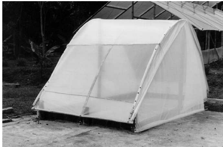
Figura 1. Secador solar parabólico experimental modificado, con muselina en el frente y la parte posterior y en sus extremos laterales para evitar el escape de broca.

hormigas depredadoras durante el secado al sol del café infestado por broca, este estudio tuvo como objetivo cuantificar el efecto depredador de las especies S. geminata , Dorymyrmex sp. y Pheidole sp., en la etapa del proceso de secado del café.