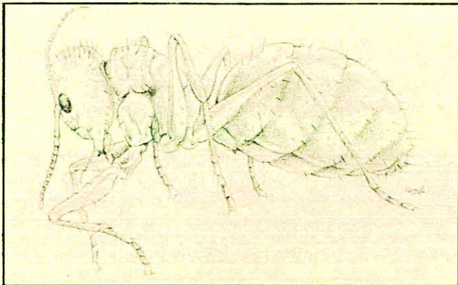
FIGURA 2.- Reina de la "hormiga loca". Volumen del abdomen unas tres veces más grande que el de la obrera.