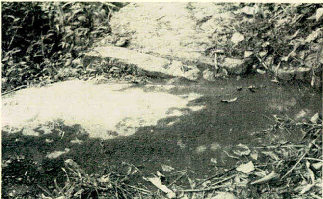
FIGURA 4.- Camino tratado con insecticida (el color blanco es el insecticida en polvo y los bordes negros son hormigas muertas).