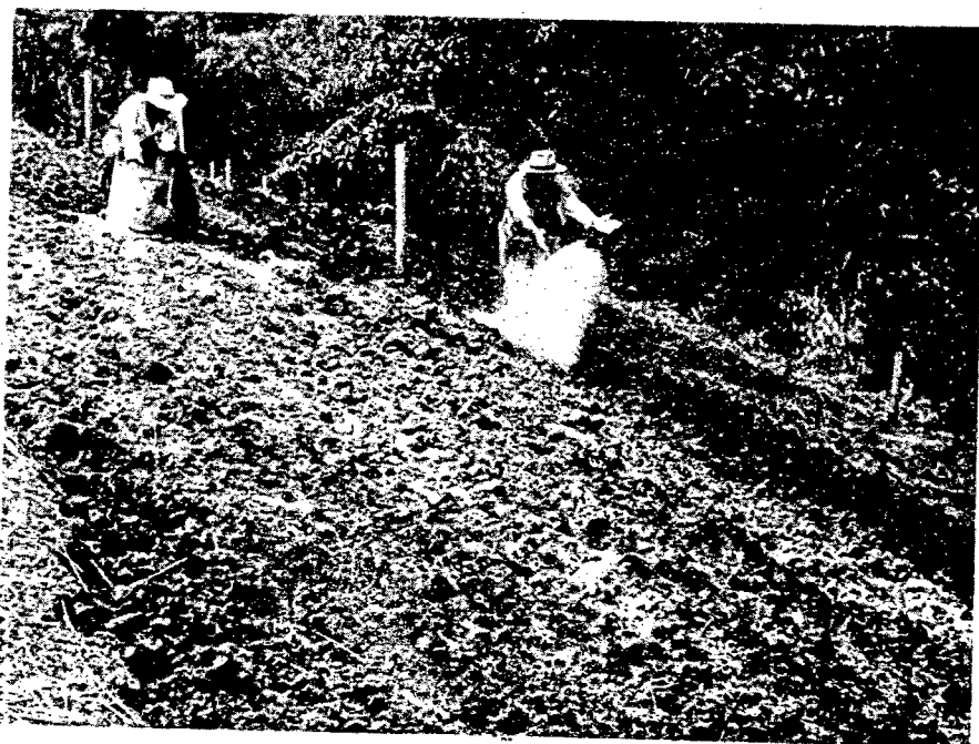
Aplicación de cal, al voleo, en las parcelas experimentales