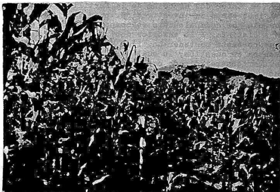
Aspecto del maíz en las parcelas experimentales, con fósforo (izquierda) y sin fósforo (derecha)