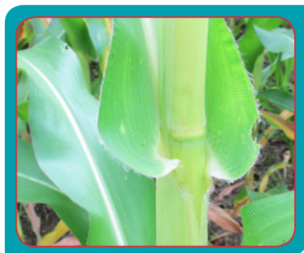
Figura 2. Hoja de maíz totalmente formada donde se muestra el collarín, clave para conocer el estado vegetativo de la planta o del cultivo.

Se realizó el manejo integrado de arvenses, se evaluó la presencia de enfermedades, en especial cercospora y complejo mancha de asfalto, para