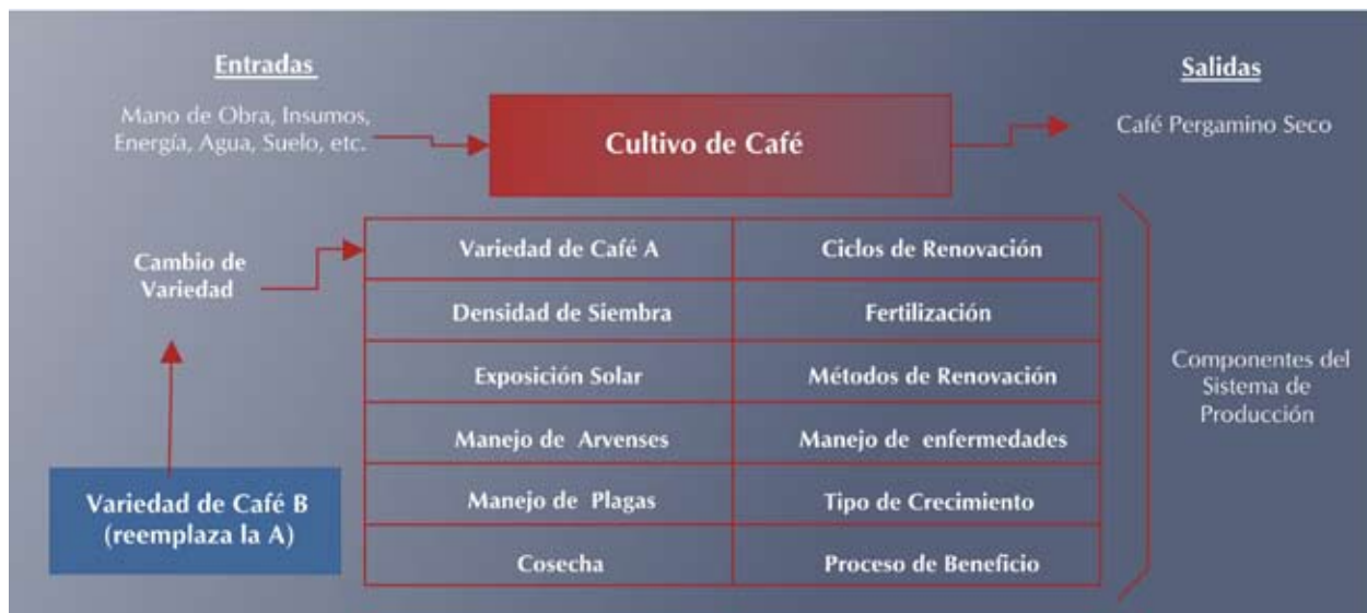
Figura 2. Diagrama del concepto de sistema de producción en café.

Para el análisis económico debe tenerse en cuenta que las nuevas variedades de café son sólo un componente del sistema, y que el reemplazo de una variedad (A), por otra de mayor productividad (B), no implica necesariamente otros cambios asociados a los demás componentes del sistema. De esta manera, únicamente los costos adicionales relacionados con la cosecha y el beneficio del café y los mayores ingresos debidos a esa mayor productividad, son los que deben tenerse en cuenta al momento de los análisis económicos (Tabla 3). Los demás costos no varían.