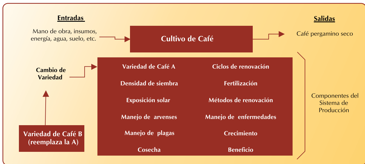
Figura 3. Concepto de sistema de producción en café.

El análisis de decisiones permite generar elementos para comprender la viabilidad de las nuevas variedades y estimular su adopción. Uno de los aspectos que debe evaluarse