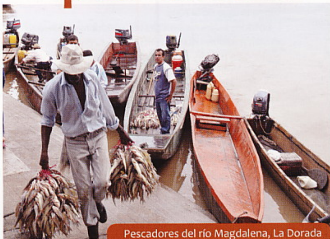
Pescadores del río Magdalena, La Dorada

Las caravanas turísticas que promueve la Gobernación de Caldas a través Secretaría de Desarrollo Económico, programas recreativos y turísticos que permiten un recorrido por los diferentes municipios del departamento, para reconocer los atractivos culturales y naturales que abundan en la región.