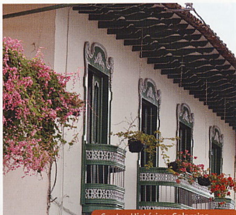
Centro Histórico, Salamina

Finalmente, el 7 y 8 de diciembre el municipio de Salamina será el anfitrión de la última caravana turística que se realizará durante su celebración de la Noche del Fuego.