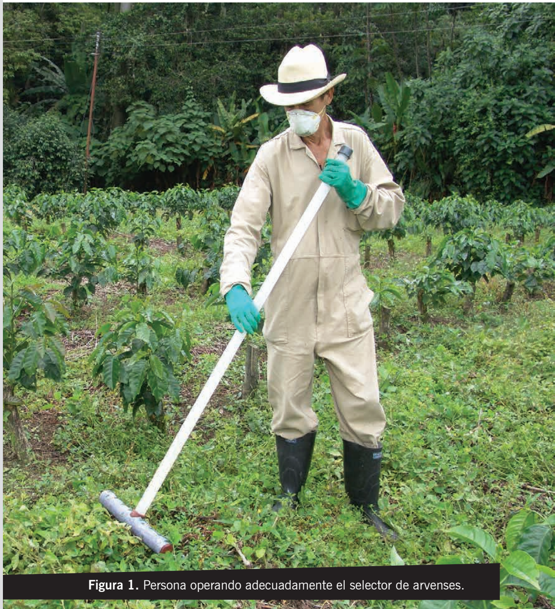
Figura 1. Persona operando adecuadamente el selector de arvenses.

Está construido en polipropileno de alta densidad (PSI). Una de las ventajas de este material, además de su alta resistencia, es que permite observar el nivel del líquido al interior del selector (Figura 2).