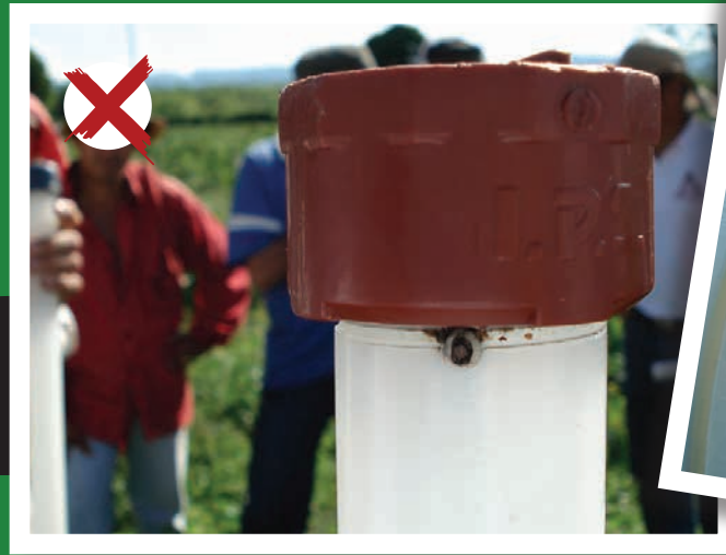
Figura 4. Obstrucción de la entrada de aire al selector de arvenses.