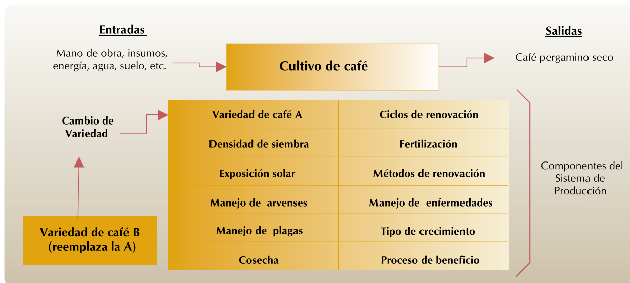
Figura 2. Diagrama del concepto de sistema de producción en café