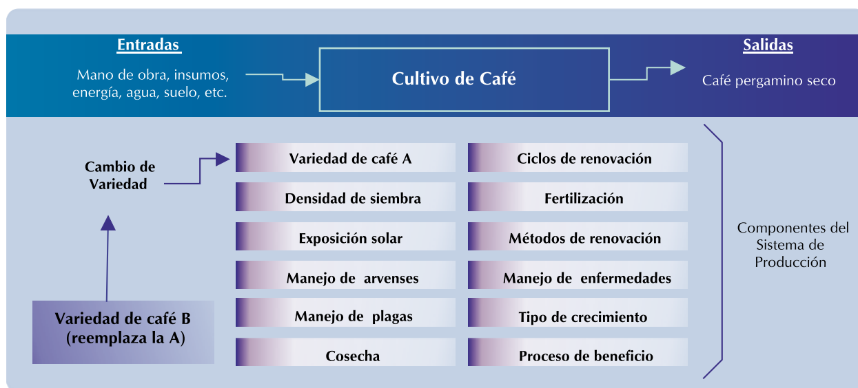
Figura 2. Diagrama del concepto de sistema de producción en café.

Para el análisis económico debe tenerse en cuenta que las nuevas variedades de café son sólo un componente del sistema, y que el reemplazo de una variedad (A), por otra de mayor productividad (B), no implica necesariamente otros cambios asociados a los demás componentes del sistema. De esta manera, únicamente los costos adicionales relacionados con la cosecha y el beneficio del café y los mayores ingresos debidos a esa mayor productividad, son los que deben tenerse en cuenta al momento de los análisis económicos (Tabla 3). Los demás costos no varían.